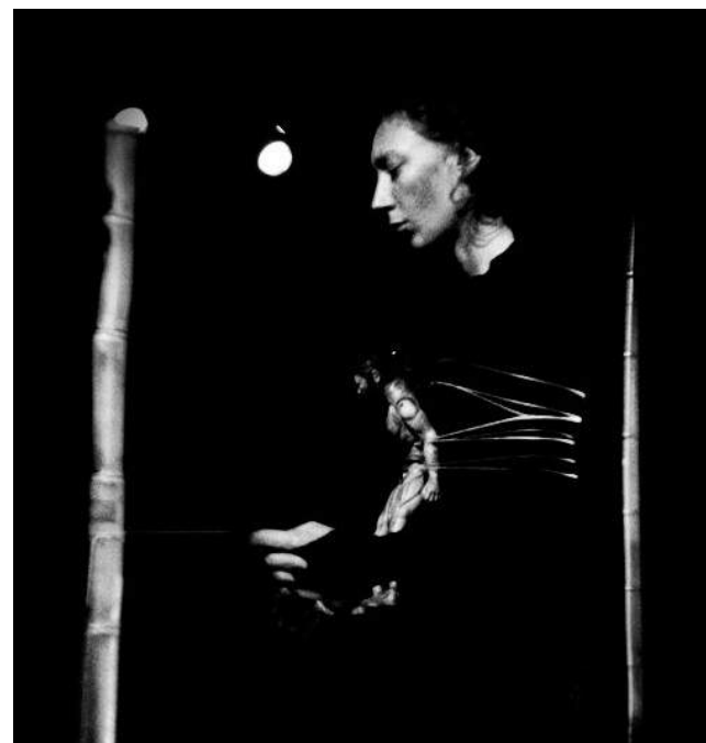
Héraklès, Sept 2012, Festival Court Toujours, NEST Thionville.